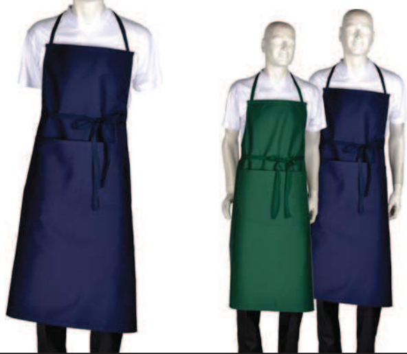
Schürze Latzschürze mit Kängurutasche