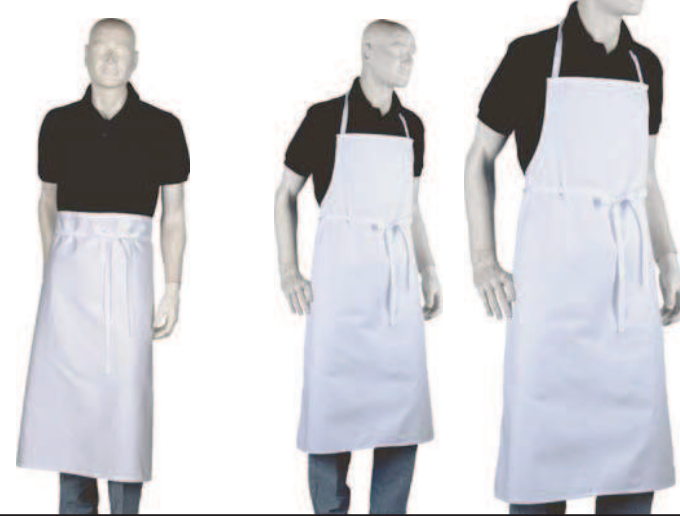
Schürze Modell 1: Latzschürze ohne Taschen Länge: 80 / 90 / 100 / 110cm, Breite: 90cm