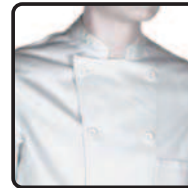
Kunstharzknopf weiss boutons nacrés blanc