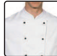
Durchsteckknöpfe boutons échangeable