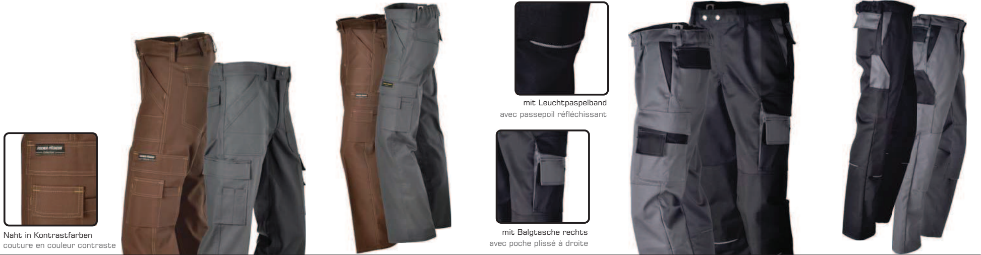
Naht in Kontrastfarben couture en couleur contraste